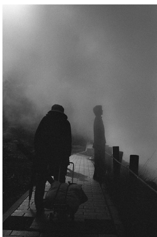
Ten Disciples(2016) TY_TD#040 p: 11x14 inch Edition of 10 Silver Gelatin Print ©Tsutomu Yamagata