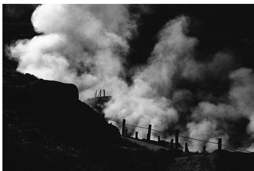
Ten Disciples(2016) TY_TD#002 p: 11x14 inch Edition of 10 Silver Gelatin Print