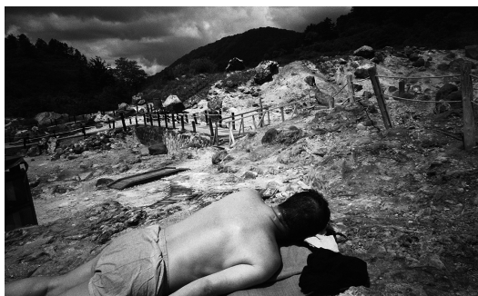
Ten Disciples(2016) TY_TD#009 p: 11x14 inch Edition of 10 Silver Gelatin Print ©Tsutomu Yamagata