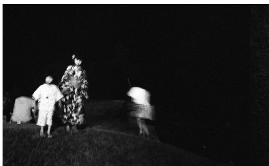
Ten Disciples(2016) TY_TD#063 p: 11x14 inch Edition of 10 Silver Gelatin Print